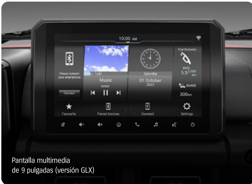
Pantalla multimedia de 9 pulgadas (versión GLX)